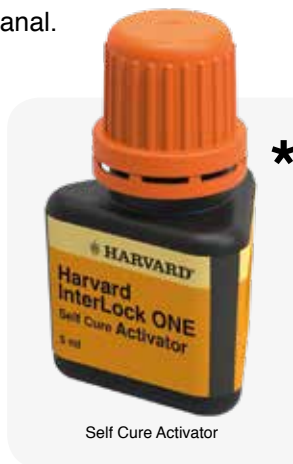
Self Cure Activator