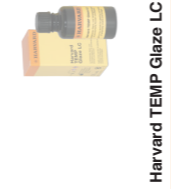
Harvard TEMP Glaze LC