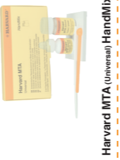
Harvard MTA (Universal) HandMix