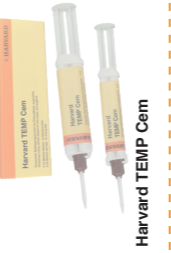
Harvard TEMP Cem