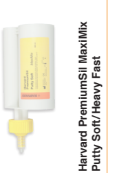
Harvard PremiumSII Heavy Fast