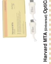
Harvard MTA (Universal) OptiCaps®