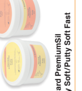
Harvard PremiumSII Heavy Fast