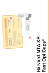
Harvard MTA XR Fast OptiCaps®