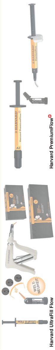
Harvard UltraFill Flow