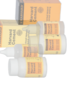
Harvard Phosphat Cement