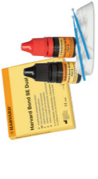
Harvard Bond SE Dual