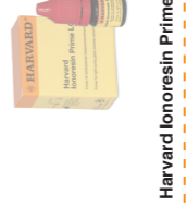
Harvard Ionosin Prime LC