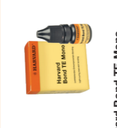
Harvard Bond TE Mono