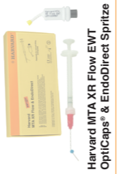
Harvard MTA XR Flow EWT OptiCaps® & EndoDirect Spritze