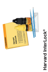
Harvard Inter-Lock® ONE Universal Adhesive