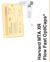
Harvard MTA XR Flow Fast OptiCaps®