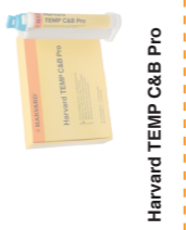
Harvard TEMP C&B Pro