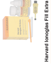
Harvard Ionoglas Fill Extra