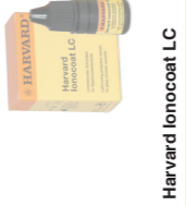
Harvard Ionocoat LC