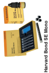
Harvard Bond SE Mono