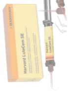
Harvard LuteCem SE