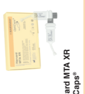
Harvard MTA XR OptiCaps®