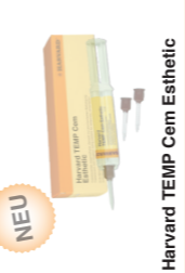
Harvard TEMP Cem Esthetic