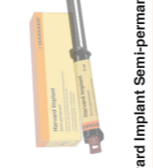
Harvard Implant Semi-permanent