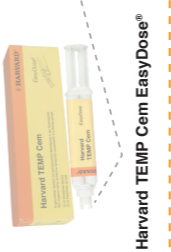
Harvard TEMP Cem EasyDose®