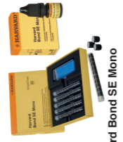
Harvard Bond SE Mono