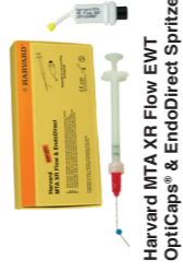
Harvard MTA XR Flow EWT OptiCaps® & EndoDirect Spritze