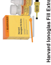
Harvard Ionoglas Fill Extra