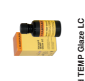
Harvard TEMP Glaze LC