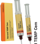
Harvard TEMP Cement