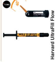
Harvard UltraFill Flow