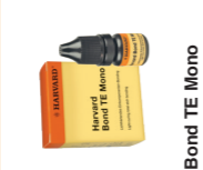
Harvard Bond TE Mono