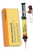
Harvard LuteCem SE