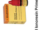
Harvard Ionoresin Prime LC