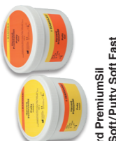
Harvard PremiumSII Putty Soft/Fast