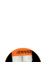
Harvard Implant Semi-permanent