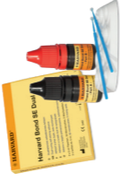
Harvard Bond SE Dual