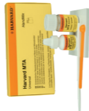
Harvard MTA (Universal) HandMix