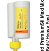
Harvard PremiumSII MaxMix Putty Soft/Heavy Fast