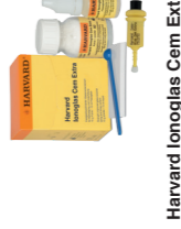
Harvard Ionoglas Cem Extra