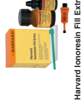
Harvard Ionoresin Fill Extra