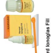
Harvard Ionoglas Fill