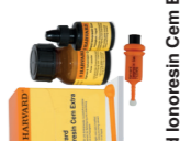
Harvard Ionoresin Cem Extra