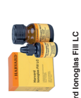
Harvard Ionoglas Fill LC