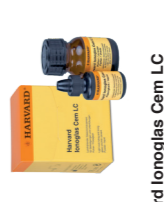
Harvard Ionoglas Cem LC