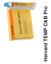
Harvard TEMP C&B Pro