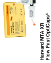
Harvard MTA XR Flow Fast OptiCaps®