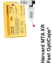
Harvard MTA XR Fast OptiCaps®