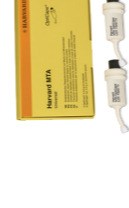
Harvard MTA (Universal) OptiCaps®