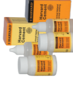
Harvard Phosphat Cement