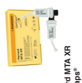
Harvard MTA XR OptiCaps®