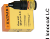
Harvard Ionocoat LC