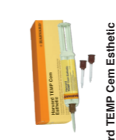
Harvard TEMP Cem Esthetic