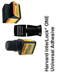
Harvard InterLock® ONE Universal Adhesive