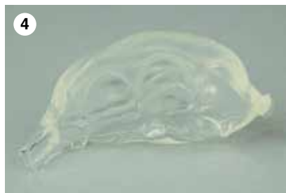
4 Vollständige Matrix