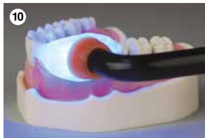
10 40 Sek. Lichthärtung durch die Matrix. Vorgang nach Entfernen der Matrix wiederholen