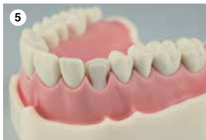
5 Präparation mit Schmelzanschrägung