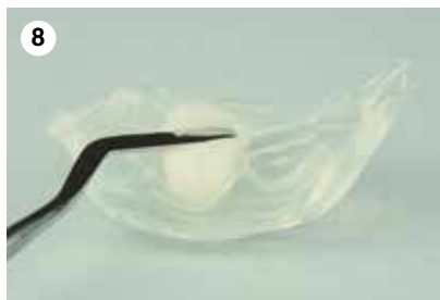
8 Applikation eines leicht erwärmten stopfbaren Composites in die Matrix, z. B. Harvard UltraFill