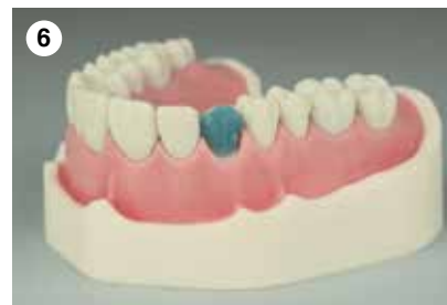
6 Ätzen der präparierten Fläche mit Harvard Etch