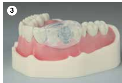
3 Schnelle Erhärtungszeit (1:20 Min. intraoral)