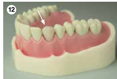
12 Fertige direkte Composite-Restauration