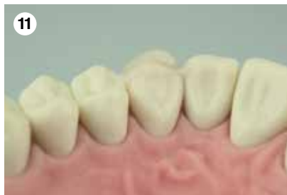
11 Überschussentfernung und Politur mit geeigneten rotierenden Instrumenten und ggf. Finierstreifen