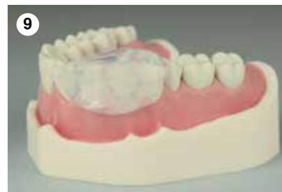
9 Korrekte Reponierung der befüllten Matrix in die Mundhöhle