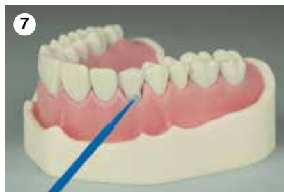
7 Auftragen eines Adhäsivsystems, z. B. Harvard InterLock ONE