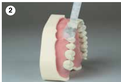
2 Applikation von Harvard TransMatrix auf die zu präparierende Fläche und Nachbarzähne